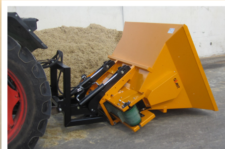
3-punts aanspan voor VDB of MVB