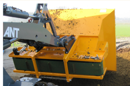
Standaard geschroefde aanspan