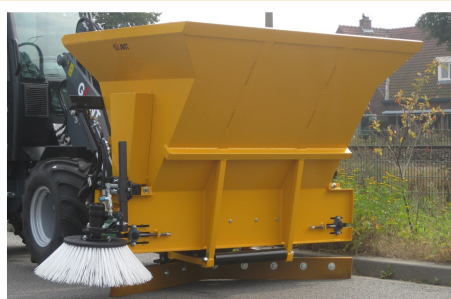
Optie: zijborstel en schuif

* Geschroefde aanspan (diverse aanspannen mogelijk)